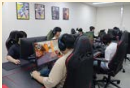
e스포츠 실습실 (아레나)