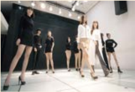
모델 실습실 (아라모드)