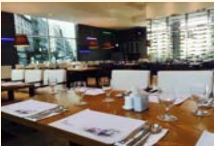
호텔경영, 호텔조리 실습실 (42번가)