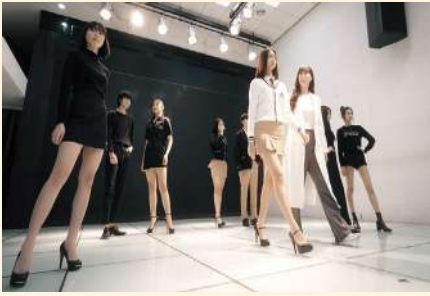
모델 실습실 (아라모드)