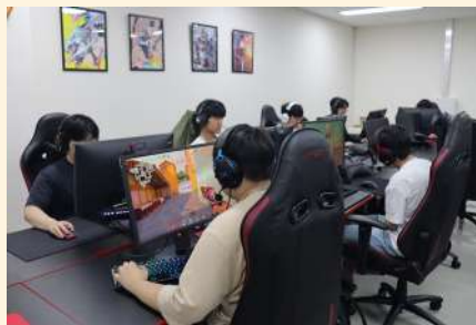
e스포츠 실습실 (아레나)