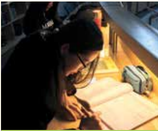
아침 독서 활동