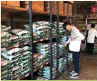
인문학 여행 업체 견학