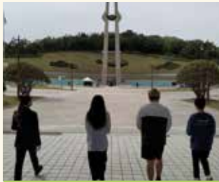
5·18 민주화운동공원 참배