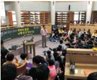
명사 초청 강연