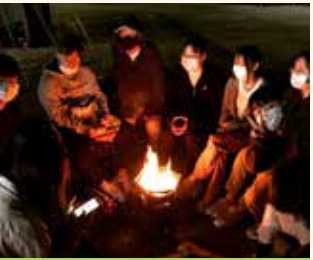
캠핑 동아리 활동