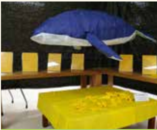
세월호 추모 전시