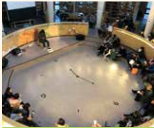
시 낭송의 밤