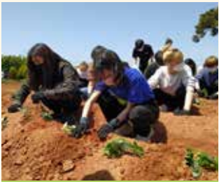
지역 사회 일손 돕기