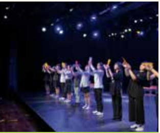
연극 동아리 활동