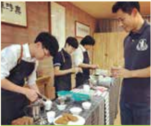
모의 판매 활동