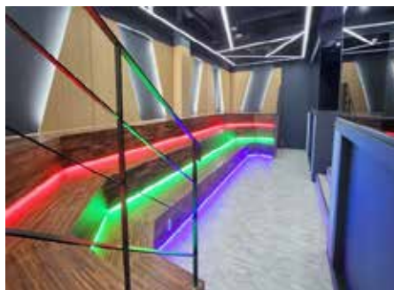
e스포츠 실습실 (아레나)