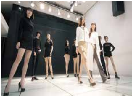
모델 실습실 (아라모드)