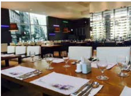
호텔경영, 호텔조리 실습실 (42번가)