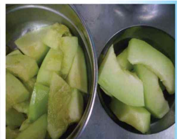
〈반품 멜론 VS 교환 멜론〉