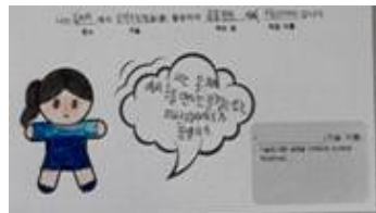
부천시 조원* 학생 (na****)

학생들 그림 아래에 있는 글은 학생들이 직접 작성한 말풍선의 내용을 담았습니다.