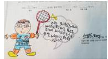
허세* 학생 (mygi****)

저는 체육관에서 배드민턴채 를 활용하여 배드민턴을 치는 배드민턴 선수 입니다. (요구 기술 : 스피드, 체력)