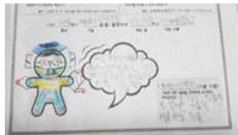
무등초등학교 최세* 학생 (cw10****)

저는 해저에서 나는 가스하이드레이트 로 연료를 개발하는 하이드레이트 기술자 입니다. (요구 기술 : 하이드레이트)