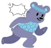
운동을 할 때

도파민이라는 단어를 들어본 적 있나요? 도파민은 뇌에서 나오는 신경전달물질입니다. 쉽게 말하면 사람의 기분을 좋게 만들어 주는 행복 호르몬이에요. 우리가 친구랑 마음이 통했을 때, 운동을 할 때, 목표했던 성적을 받았을 때 행복하고 짜릿한 기분을 느끼는 것은 “도파민”이 뇌에서 나오기 때문이에요. 이처럼 도파민은 “행복한” 기분을 느끼게 해줍니다. 그리고 우리는 행복한 감정을 다시 느끼고 싶어서 도파민이 나오는 행동을 반복하게 됩니다. 그렇다면 도파민은 우리에게 좋기만 할까요?