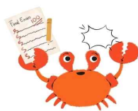
목표했던 성적을 받았을 때