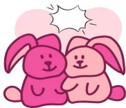
친구와 마음이 통했을 때