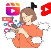
SNS나 유튜브 등 과도한 스마트폰 사용