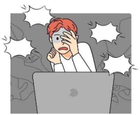
잔인한 만화나 드라마를 볼 때