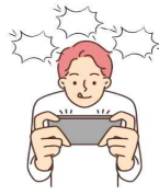
게임 할 때

행복하게 하고 목표를 이루기 위해 행동 할 수 있게 도와줘서 우리의 삶을 도움이 돼요.