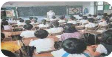
칠판, 분필, 종이교과서 이용