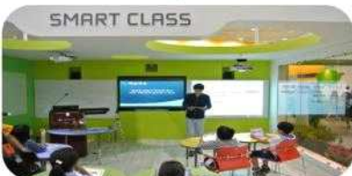
전자칠판, 스마트패드, 디지털 교과서 이용

소프트웨어가 등장함으로써 우리 생활에는 어떤 변화가 생겼을까요? 우리가 주로 생활하는 영역은 크게 가정, 학교, 직장, 사회, 여가 공간 등입니다. 소프트웨어는 이 모든 영역에서 이용되고 있으며 각 영역에 많은 변화를 가져오고 있습니다. 소프트웨어는 반복되는 작업을 자동화하고, 복잡한 일을 단순화하며, 일하는데 걸리는 시간을 단축시킵니다.