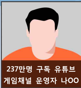
237만명 구독 유튜브 게임채널 운영자 나OO