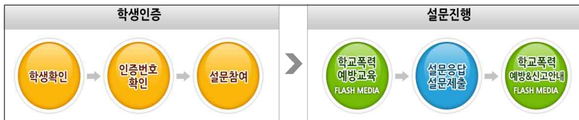
[설문조사 참여 절차]