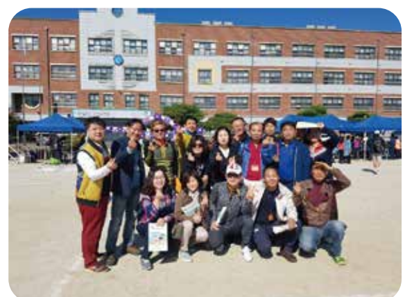
8회 동창회 단체사진