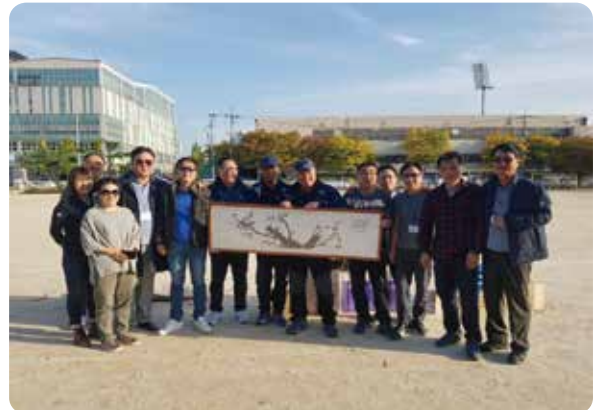
5회 선배님 감사합니다