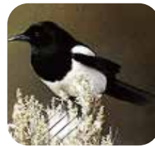
교조 : 까치