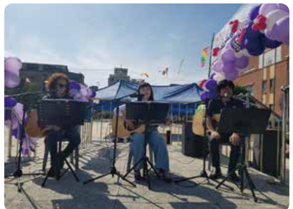
멋진 공연과 함께