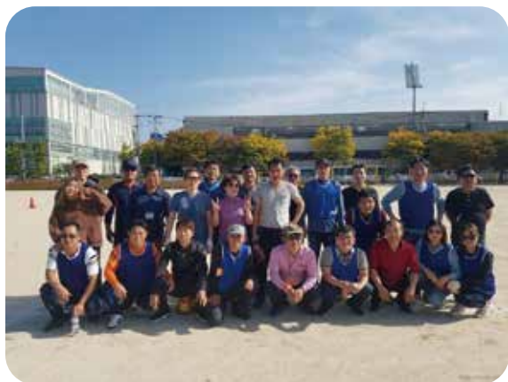
12회 동창회 단체사진