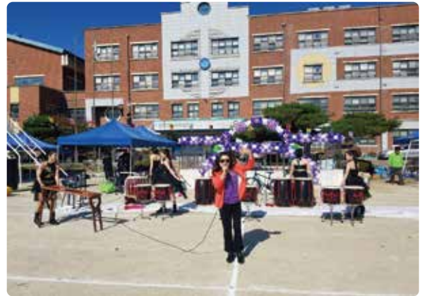
멋진 공연과 함께