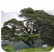
교목 : 소나무