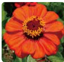
교화 : 백일홍