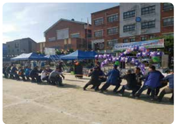
다같이 영차 영차