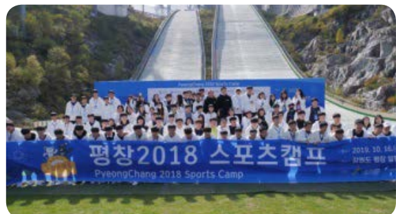
[ 2018년 스포츠 캠프 시범 운영 ]