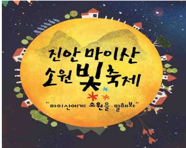
소원축제 포스터 디자인