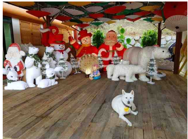
산타 소원 이야기