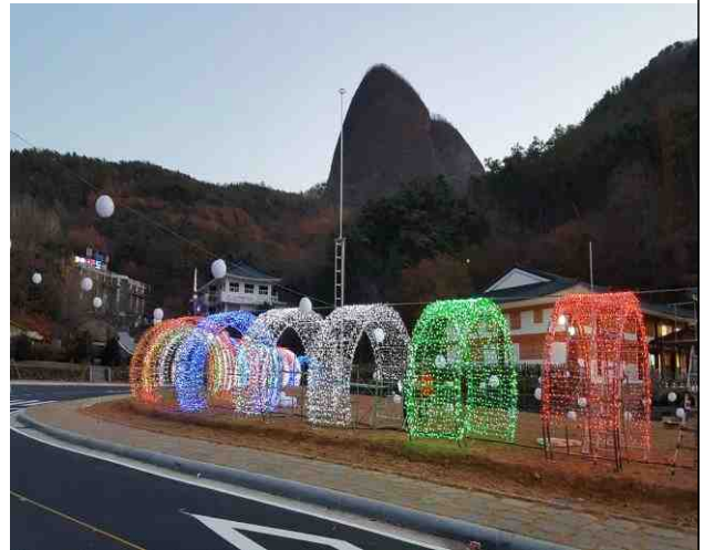
소원빛 축제와 마이산