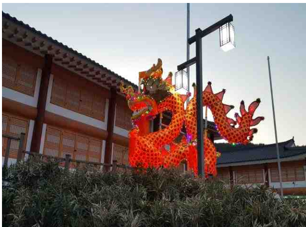
소원 용 조형물