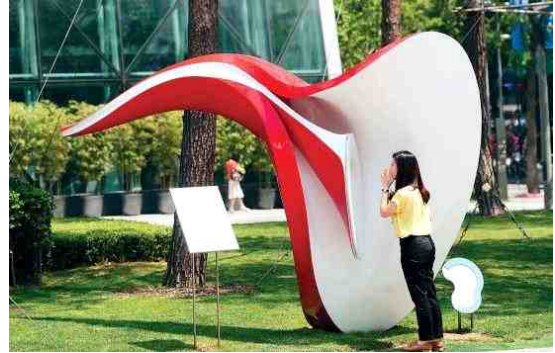
서울시청에 있는 귀모양 스피커