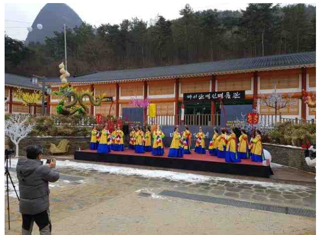
소원버스킹공연 : 금척무등