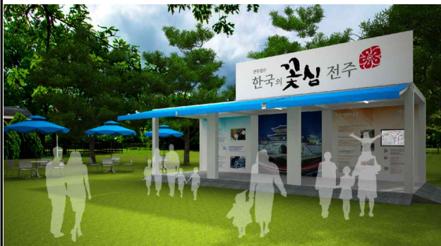
전주시 에너지 홍보관