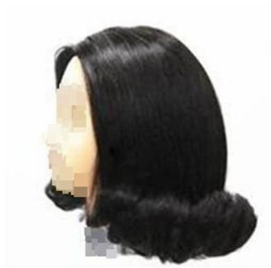
제2형 - 바깥말음(이사도라)