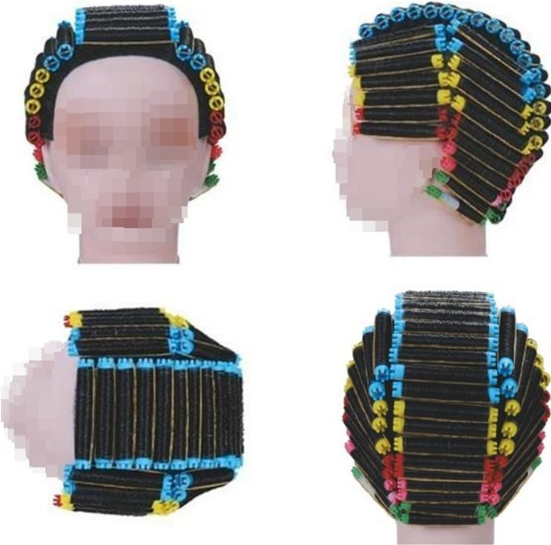
제1형 - 기본형(9등분)