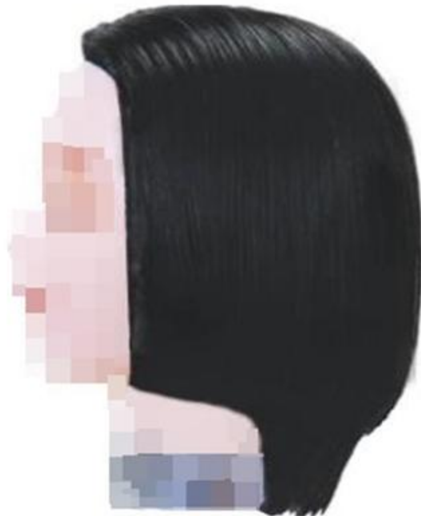
제3형 - 그레듀에이션 커트