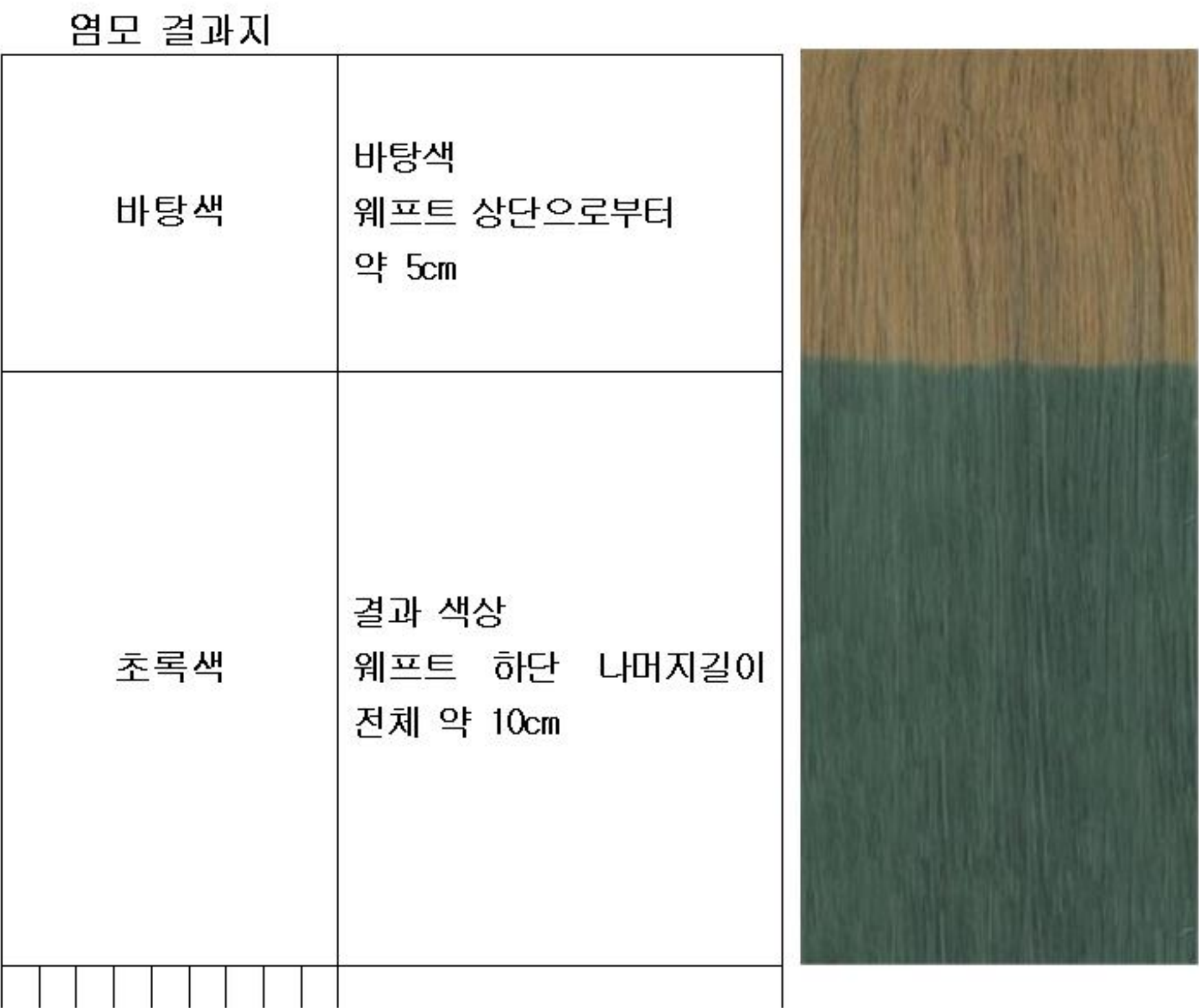
- 헤어 컬러링 3 (초록) -