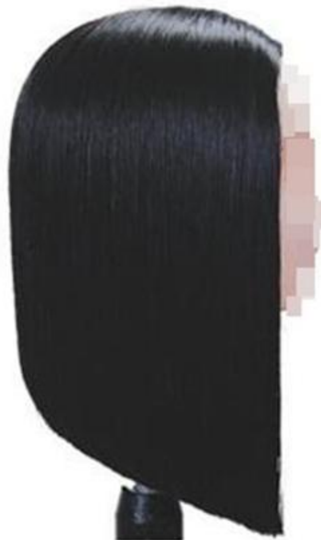
제1형 - 스파니엘 스타일 커트