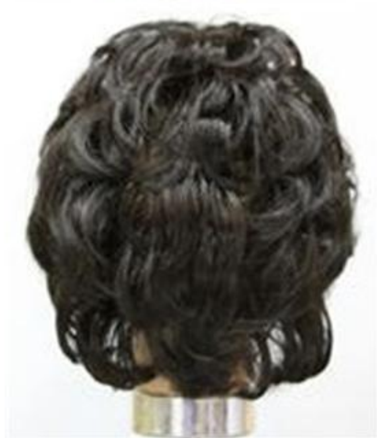
제4형 - 롤컬(레이어드)