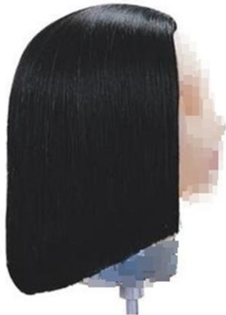
제2형 - 이사도라 스타일 커트