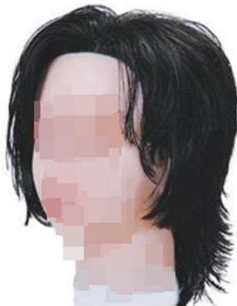
제4형 - 레이어드 커트