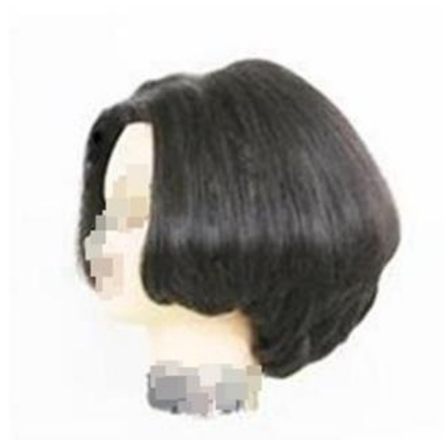
제3형 - 안말음(그레듀에이션)