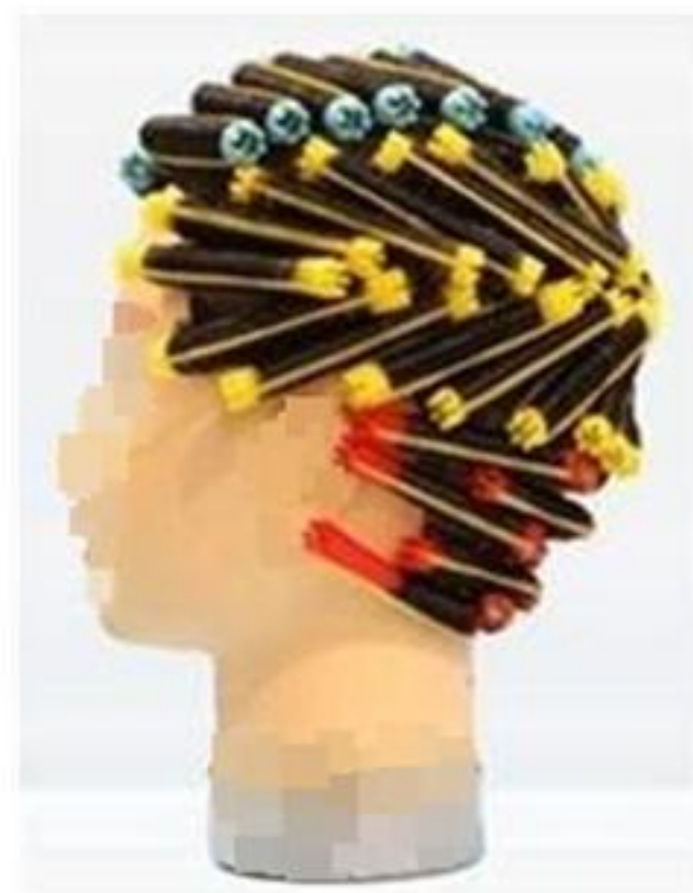
제2형 - 혼합형