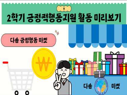
토큰 제도 도입을 위한 사전교육