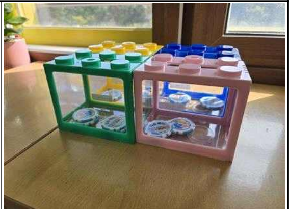
학급 및 개인별 토큰(코인) 획득 기간