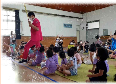
공립유치원 연합활동 버블놀이