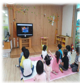
다양한 실내놀이터를 감상하며 구상해요.