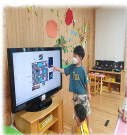
놀이터 시안을 보며 토의해요.