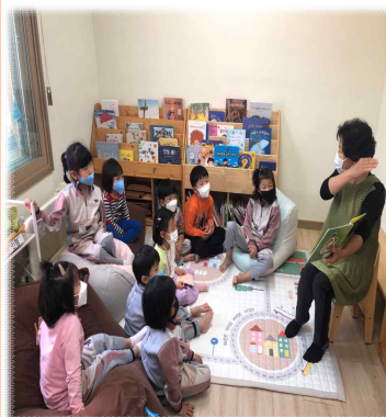
지역사회 연계 활동 할머니에게 듣는 동화 이야기