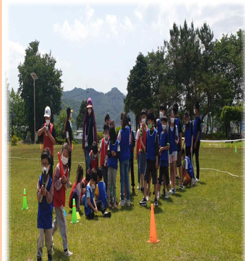
초등학교 연계 활동 초등학교 형님들과 함께 하는 체육대회