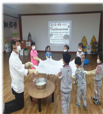
지역사회 연계 활동 우리 고장의 특산물, 치즈를 만들어요.