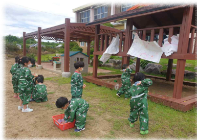
오감만족 퍼포먼스 물풍선아! 팡팡! 터져라