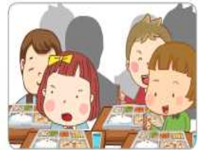
공공생활 구성원의 자질 함양