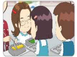
나눔과 배려, 공동체 의식 함양