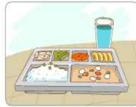
바른 식생활 습관 형성