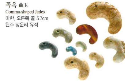
곡옥 曲玉 Comma-shaped Jades 마한, 오른쪽 끝 5.7cm 완주 상운리 유적