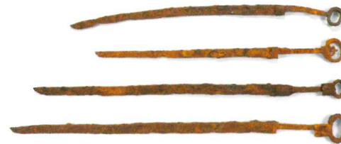
고리자루칼 環頭大刀 iron Sword with Ring Pommel 마한, 맨위 길이 94.2cm 완주 상운리 유적