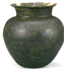
검은간토기(짧은 목 항아리) 黑色磨研土器 Black Burnished Pottery(Short-necked Jar) 마한, 높이 23.7cm 완주 상운리 유적