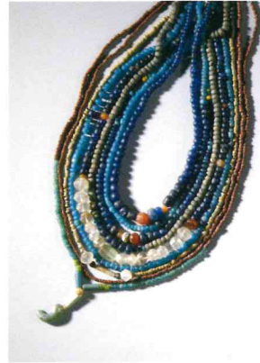
옥 목걸이 일괄 Necklace Made by Jades 마한, 지름 0.2~3.0cm 완주 상운리 유적

People of Wanju, the Pride of Mahan in Jeollabuk-do Province