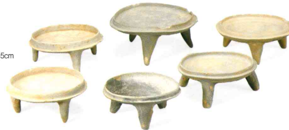
세발 접시 三足器 Tripod Pottery 백제, 가운데 위 높이 6.5cm 완주 용교 유적

전북 마한사회의 중심에는 완주가 있고 대표적으로 상운리 유적이 있다. 현재까지 발견된 마한계의 무덤 중 최대 규모와 밀집도를 보이는데, 30여 기의 분구묘에서 150여 기의 매장주체부가 확인된다. 300여 점의 토기와 약 500점의 철기, 그리고 마한유적의 특징인 6,000점이 넘는 옥류가 출토되어 당시 상운리 사람들의 위세를 짐작케 한다.