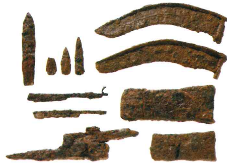
완주 신평, 갈동 유적 출토 철기 Artifacts From Shimpung, Wanju, Gal-dong, Wnaju 초기철기시대, 오른쪽 아래 길이 12.1cm 완주 갈동, 신평유적 출토 철기류