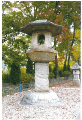
군산 발산리 석등 群山 鉢山里 石燈 Stone Lantern 통일신라 말~고려초, 높이 2.5m 완주 봉림사지

이번 전시에서는 봉림사터에 서려 있는 후백제 사람들의 염원과 기원을 현대미술의 시각에서 새롭게 해석해 보았다. 작품들은 언젠가 한자리에 모일 봉림사의 모습을 기대해주고 말세와 같은 암울한 세상에 현실을 거부했던 혁명이 전환과 후백제 사람들의 이상을 표현하고자 하였다.