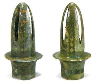
장대투집 방울 靑銅竿頭鈴 Bronze Ritual Rattle 초기철기시대, 높이 15.8cm 완주 신평 유적