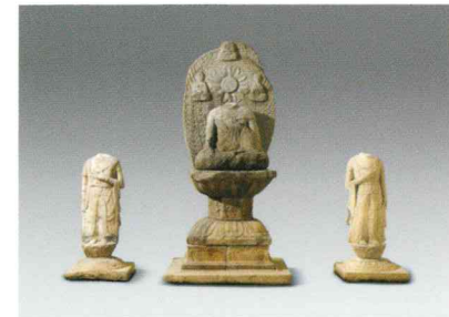
봉림사지 삼존석불 鳳林寺址 三尊石佛 Stone Buddha 통일신라 말~고려초, 가운데 높이 2.94m 완주 봉림사지

People of Later Baekje Aspiring to Unify the Three Hans