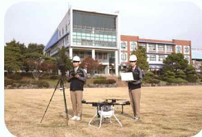
소형무인기 운용 실습