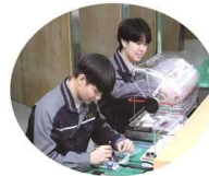
첨단시설과 (1학급) 18명