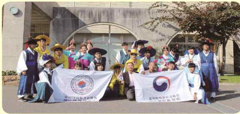
일본 오카야마현 현립 다카마츠(高松) 농업고등학교와 교육 문화 교류