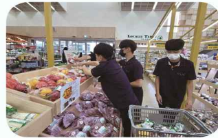
로컬푸드 판매 교육