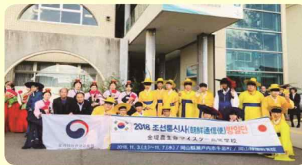
일본 오카야마현 현립 다카마츠(高松) 농업고등학교와 교육 문화 교류