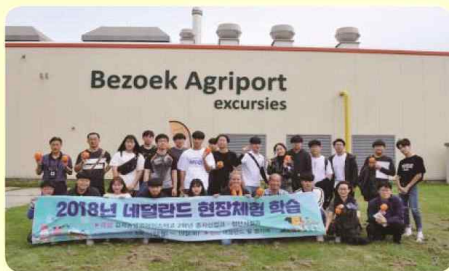
네덜란드 종자산업 분야 현장 실습