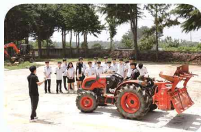
농업기계 운전 · 작업