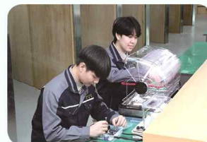
전기 · 전자기초