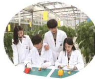
종자산업과 (2학급) 36명