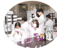
바이오식품과 (2학급) 36명