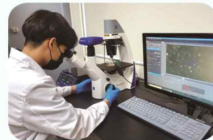
동물세포 배양 및 면역분석