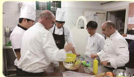
이탈리아 푸드 조리 현장 학습