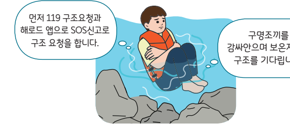
< 구조 전까지 체온유지(보온) 자세 >