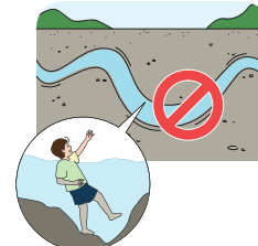
< 갯골에 접근 금지 >