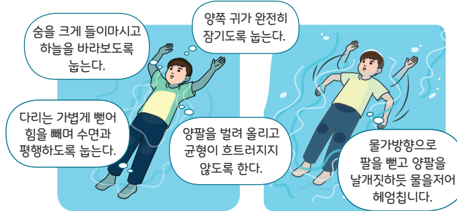
< 누워뜨기 자세 >