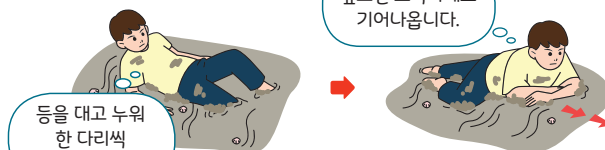
< 갯벌에 무릎이 빠진 경우 탈출 요령 >