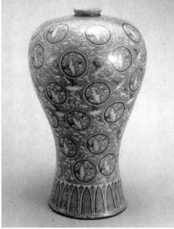
▲ 청자 상감 운학무늬 매병

07 다음과 같은 청자를 만들 때 필요한 기술로 알맞은 것을 두 가지 고르시오. .... ( )