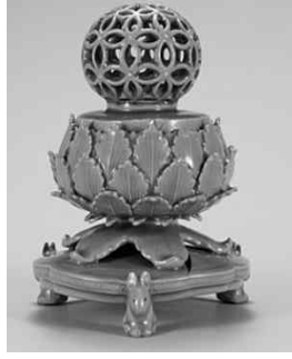
▲ 청자 칠보 투각 향로