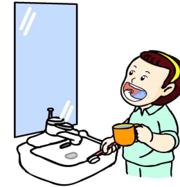
3. 물로 입 헹구기