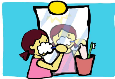
2. 윗니 아랫니 골고루 닦기