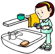
1. 칫솔에 치약 짜기