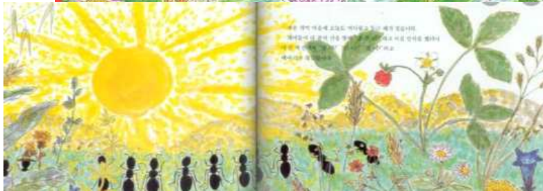
그림 : 기시다 에리코 지음 . 출판사 : 한림출판사