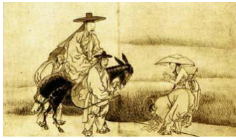
▲ 신분 간의 관계를 보여 주는 그림 - 김득신 &lt;노상알현도&gt;