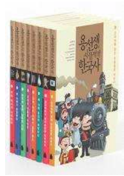
용선생의 시끌벅적 한국사 1-10권