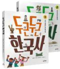
두근두근 한국사 1-2권