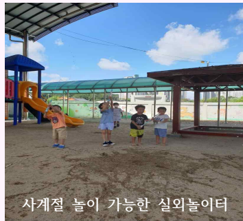
사계절 놀이 가능한 실외놀이터