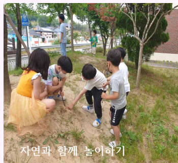
자연과 함께 놀이하기