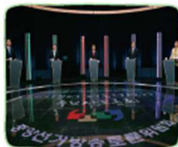
㉢ 제9대 대통령 선거 후보자 토론회

㉣ 6월 민주 항쟁 이후 대통령 직선제로 선출된 역대 대통령과 지방 자치제의 시행 과정