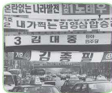
㉠ 제13대 대통령 선거 후보들의 홍보 현수막

6월 민주 항쟁의 결과 6·29 민주화 선언이 발표되었고, 그에 따라 1987년 제13대 대통령 선거가 직선제로 시행되었다. 이것은 국민들이 선거로 대통령을 뽑았던 1971년 제7대 대통령 선거 이후 16년 만의 일로, 수많은 시민과 학생들이 군사 독재를 끝내고 민주화를 이루고자 노력한 결과였다. 대통령 직선제는 오늘날까지 계속 시행되고 있다.