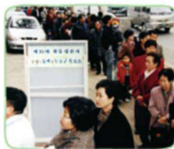
㉡ 제13대 대통령 선거 당시 투표하려고 투표소 앞에 줄서 있는 시민들