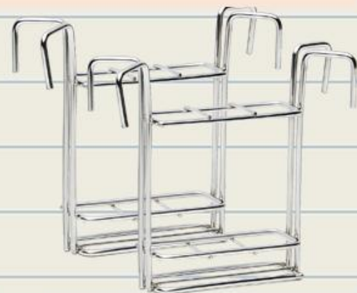
가열용 시험관대 2개