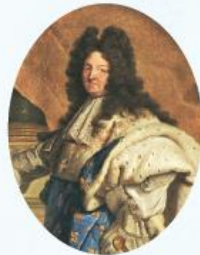
㉠ 루이 14세(1638~1715)

루이 14세는 프랑스 역사상 가장 강력한 권력을 가졌던 왕이다. 그는 프랑스가 유럽에서 가장 강한 국가라는 것을 알리려고 수차례 전쟁을 일으켰다. 그리고 전쟁에서 여러 번 승리를 거두며 주변 국가로 영토를 넓혀 갔다. 이런 힘을 바탕으로 루이 14세는 마음대로 법을 만들어 집행했다. 귀족들을 궁전에 초대해 연회를 즐기면서 세금을 낭비했으며, 세상에서 가장 크고 화려한 베르사유 궁전을 짓기도 했다.