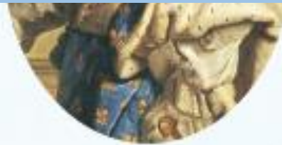
④ 루이 14세(1638~1715)

하지만 아무도 루이 14세의 결정을 말릴 수가 없었다. 결 국 백성들은 먹고살기 어려워 졌고 궁전을 짓는 공사에 동 원되어 사고로 다치거나 죽기 도 했다.