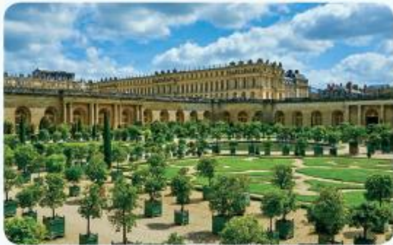
㉠ 베르사유 궁전(프랑스)

루이 14세는 프랑스 역사상 가장 강력한 권력을 가졌던 왕이다. 그는 프랑스가 유럽에서 가장 강한 국가라는 것을 알리려고 수차례 전쟁을 일으켰다. 그리고 전쟁에서 여러 번 승리를 거두며 주변 국가로 영토를 넓혀 갔다. 이런 힘을 바탕으로 루이 14세는 마음대로 법을 만들어 집행했다. 귀족들을 궁전에 초대해 연회를 즐기면서 세금을 낭비했으며, 세상에서 가장 크고 화려한 베르사유 궁전을 짓기도 했다.