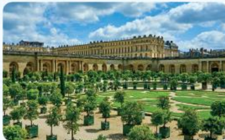
㉡ 베르사유 궁전(프랑스)

하지만 아무도 루이 14세의 결정을 말릴 수가 없었다. 결국 백성들은 먹고살기 어려워졌고 궁전을 짓는 공사에 동원되어 사고로 다치거나 죽기도 했다.