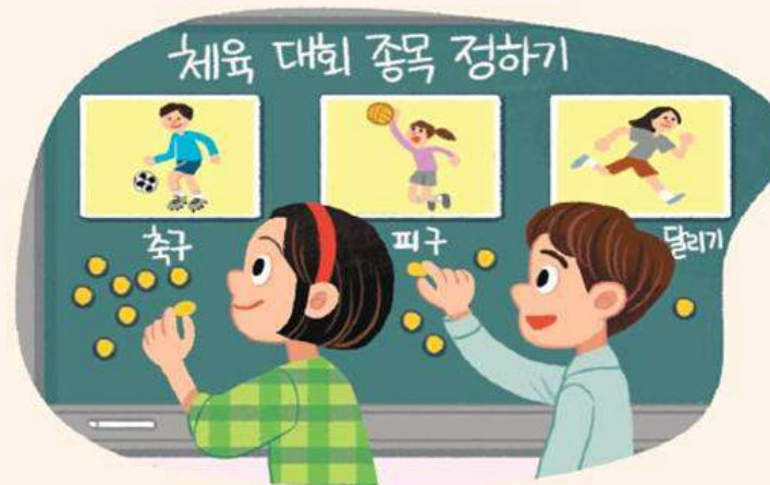
㉢ 학급 회의로 안건 결정