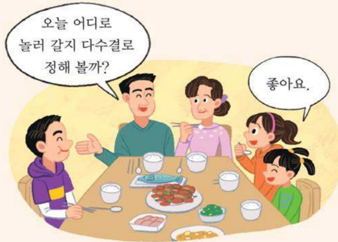
㉠ 일상생활에서의 의사 결정