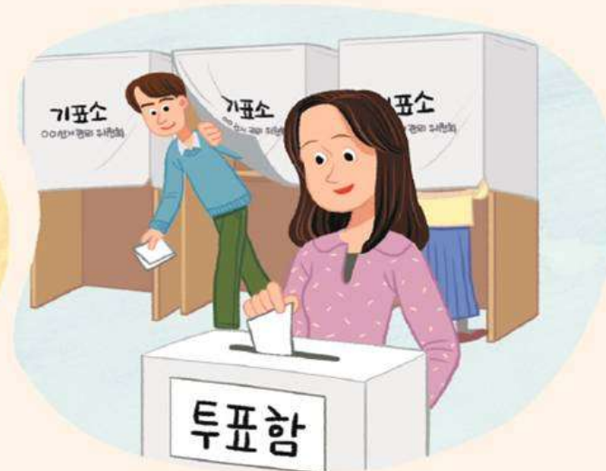
㉡ 선거로 대표 결정