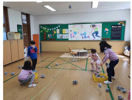
<까치야 까치야 놀이 활동>