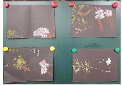
<생태 체험 "봄" 꽃길 걷기>