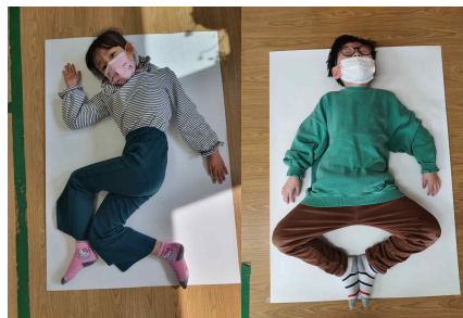
<봄-내 몸을 살펴봐요>