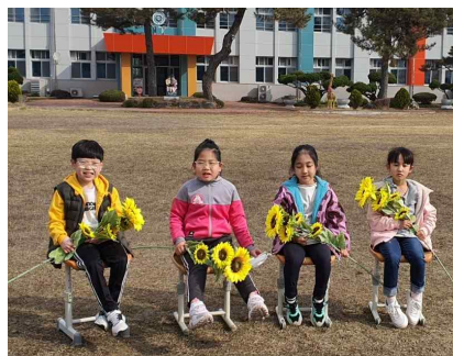
<전교생 사진 찍는 날>