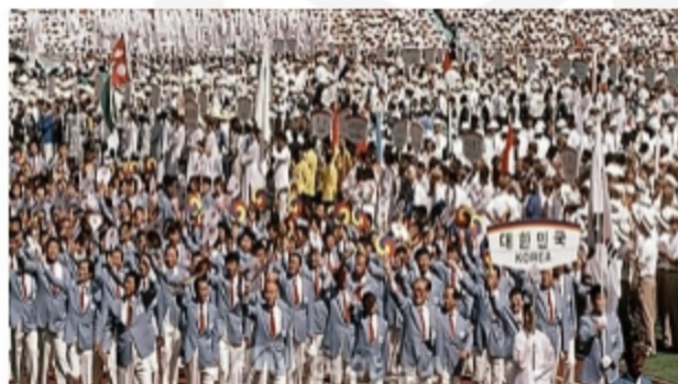
개회식에서 선수단 입장 모습

일정한 경제 규모가 되어야 개최가 가능한 올림픽. 드디어 1988년 서울올림픽이 열렸다. 올림픽위원회 회원국 167개국 중 160개국이 참여하여 전 세계인의 화합을 위한 스포츠 축제로 진행되었다. 현대식으로 지은 초대형 경기장, 넓고 깨끗하게 포장된 도로, 고층 빌딩과 서울 시내 곳곳을 잇는 지하철, 사람들의 친절한 미소. 전 세계 사람들이 올림픽을 통해 본 한국의 높은 경제 성장을 한강의 기적이라고 불렀다.