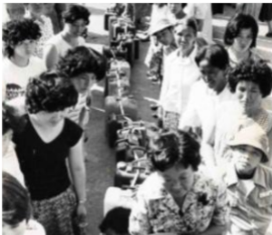
석유파동의 영향으로 주유소에 몰려든 석유통

1979년 발생한 석유파동으로 석유값이 급등했다. 석유를 구하지 못한 시민들이 석유통을 들고 주유소로 몰려들었다.