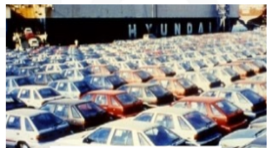
미국 수출을 기다리는 차량

자동차 산업은 처음으로 해외에 수출한 국산 자동차 포니 이후 본격적으로 세계 시장에 제품을 수출하면서 크게 성장하고 있다. 또한 그 동안 컬러텔레비전 생산 등 기술을 개발해왔던 전자산업도 수출이 크게 늘어나고 있다.