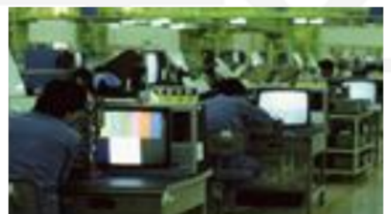
컬러텔레비전을 만드는 모습