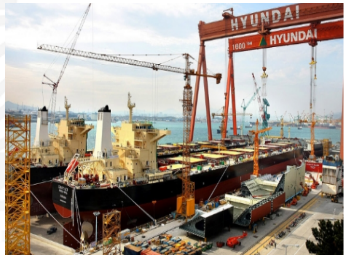
현대중공업 울산조선소 전경

값싼 가격으로 수주를 따오는 중국 조선업계와 차별화를 두기 위해 우리 조선업이 가져야할 특별한 무기가 절실한 시점이다.