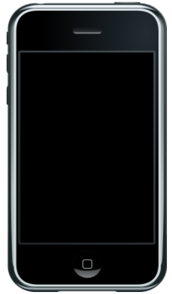
2007년 개발한 최초의 스마트폰

2010년 초기, S기업과 함께 국내 스마트폰 시장을 선도하던 L기업의 추락이 계속되는 가운데, 어떤 기업이 세계 스마트폰 시장을 정복할지 기대된다.