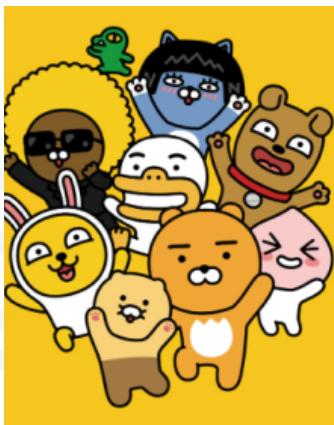
두 기업을 대표하는 캐릭터 이미지

정보 통신 기술이 발전함에 따라, 물건을 만들고 팔아 돈을 버는 전통적인 기업의 수익 구조 뿐만 아니라 인터넷 상의 활동 공간과 다양한 서비스를 제공하며 수익을 얻는 구조도 생겨나고 있다. 특히, 시장 확보를 위한 N사와 K사의 치열한 경쟁이 눈에 띈다. 국내 최대 검색엔진 점유율을 가지고 있는 N사는 많은 이용자들에게 쇼핑과 메타버스로 사업을 확장하고 있으며, 모바일 메신저 시장을 점유한 K사는 이모티콘 플랫폼, 금융 플랫폼, 교통 플랫폼 등을 중심으로 발을 넓혀가고 있다. 온라인에서의 사회적 활동이 더 활발해질 미래 대한민국에서 어떤 기업이 플랫폼 시장을 점령할지 기대된다.