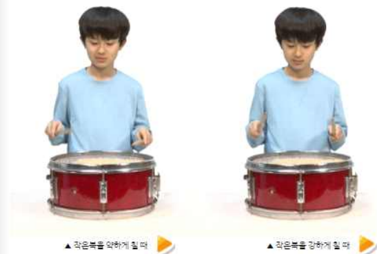
▲ 작은북을 약하게 칠 때