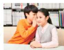
▲ 도서관에서 친구와 이야기할 때