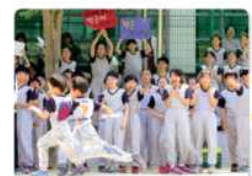
▲ 체육 대회에서 응원할 때