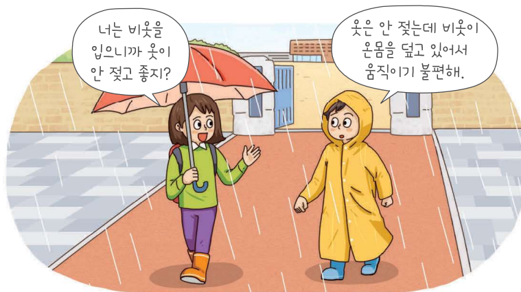
▲ 우산을 쓰고 비옷을 입은 모습

우리는 날씨에 따라 비옷이나 털장갑과 같은 다양한 날씨 용품을 사용합니다. 날씨 용품은 우리 생활을 편리하게 하지만, 때때로 불편함을 주기도 합니다. 우리가 사용하는 날씨 용품의 불편한 점을 생각해 보고, 이를 개선하는 날씨 용품을 설계해 볼까요?