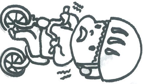
어린이집에서 노는 나 모습