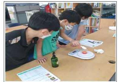
천연원료와 보건힐링 캠프