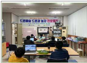
군집비행예술 코딩드론, 드림하이

‘방과후마을학교’는 수요자 부담없이 운영할 예정이며, 공모를 통해 선정된 꿈바탕교육협동조합 의 ‘방과후마을학교’ 프로그램을 아래와 같이 안내하오니, 이 프로그램에 참여를 원하는 학생들은 해당기관에 신청하여 주시기 바랍니다.