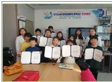
C-STEAM 진로프로젝트 ‘□으로 직업하자’