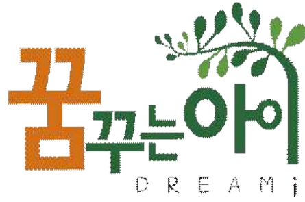
꿈꾸는 아이 1F