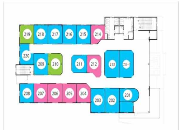
꿈꾸는 아이 2F