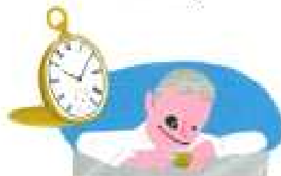
정밀 기기 제조