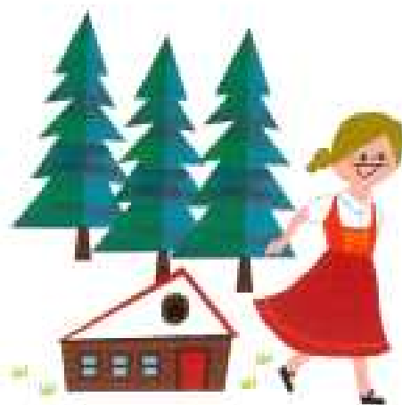
알프스의 소녀 하이디