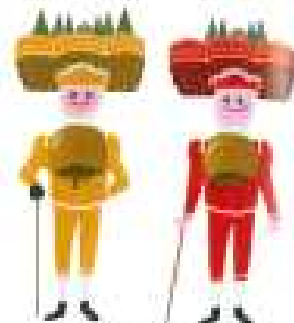
승남 행사 질베스터플라우전