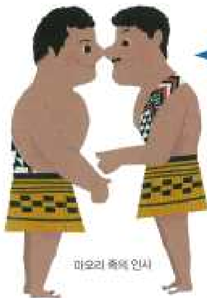
마오리 족의 인사