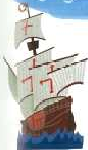
대항해 시대의 범선