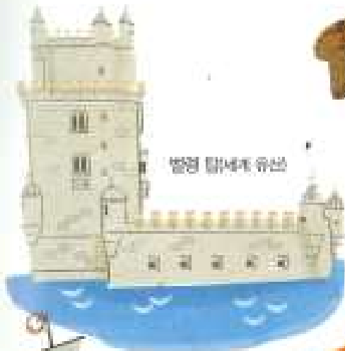
벨렘 탑세게 유산