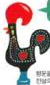
행운을 가져다준다고 하는 전설의 수탉 '갈로' 형상