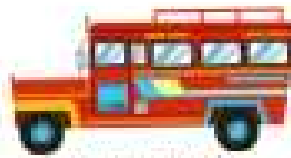
합승 택시 지프니