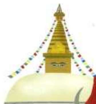
스와임부나트 사원(세계 유산)