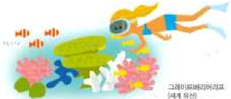
그레이트배리어리프 (세계 유산)