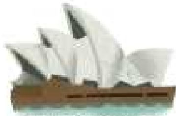
시드니 오페라 하우스 세계 유산