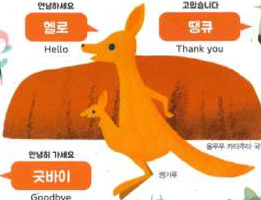
울루루 카타투타 국립 공원 세계 유산에 에어즈 록