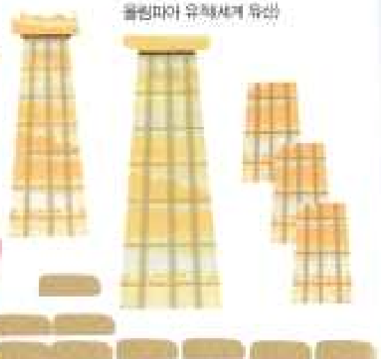
올림피아 유해세계 유산