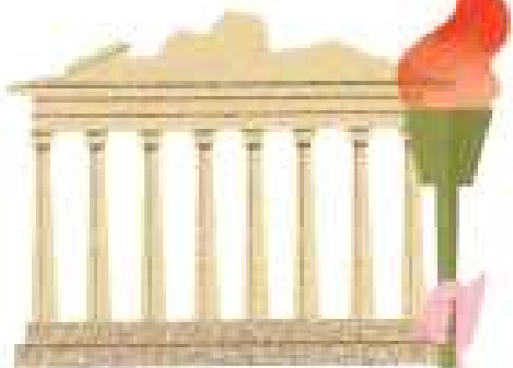
파르테논 신전(세계 유산)