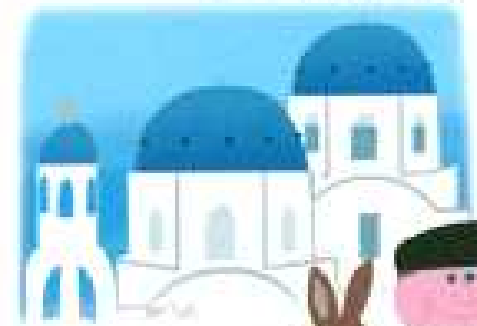
신토리니 섬의 하얀 벽 건물