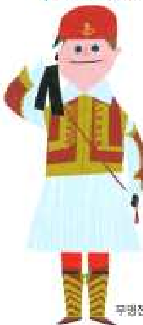
무명전사의 무늬를 지키는 위병