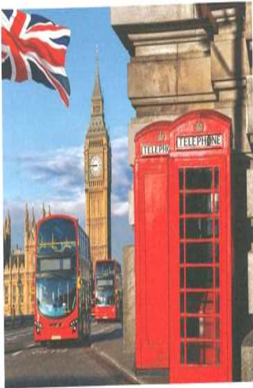
사진 속 시계탑의 정식 명칭은 엘리자베스 타워이지만 흔히 빅 벤이라고 불립니다. 영국 런던에서는 빨간 이층버스와 빨간 공중전화박스를 많이 볼 수 있어요.