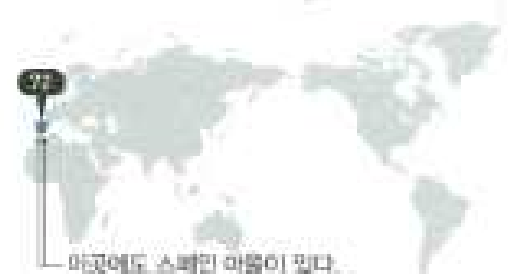
아곳에도 스페인 아들이 있다.