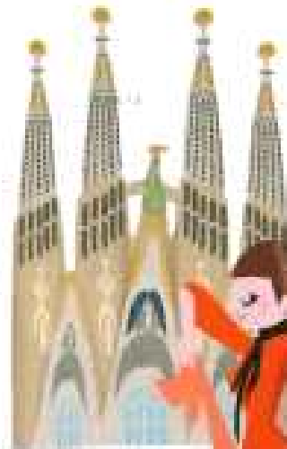
사그라다 파밀리아 (세계 유산)