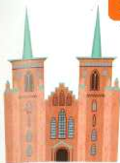
로스킬드의 대성당(세계 유산)