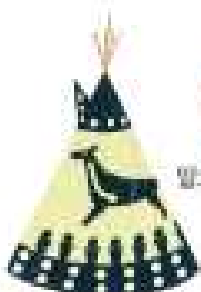
이동식 집 티피