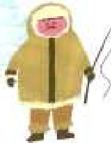
캐나다인 로키 산맥 (세계 유산)